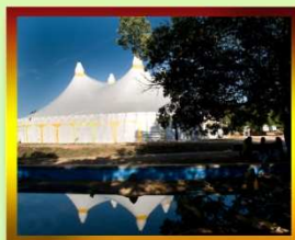
Chapiteau événementiel (été 2008)

La location de l'esplanade nue permet l'organisation d'événement d'envergure grâce à sa superficie de 5000 m 2 (damée sur 2000 m 2 ), la présence de multiples points d'eau et d'électricité (en tri-phasé), un parking ombragé pour 250 voitures et de nombreuses toilettes écologiques.