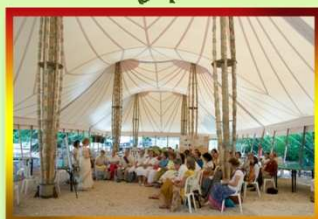
Chapiteau restaurant - ateliers (été 2008)